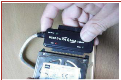
IDE→USB変換ケーブルによる作業